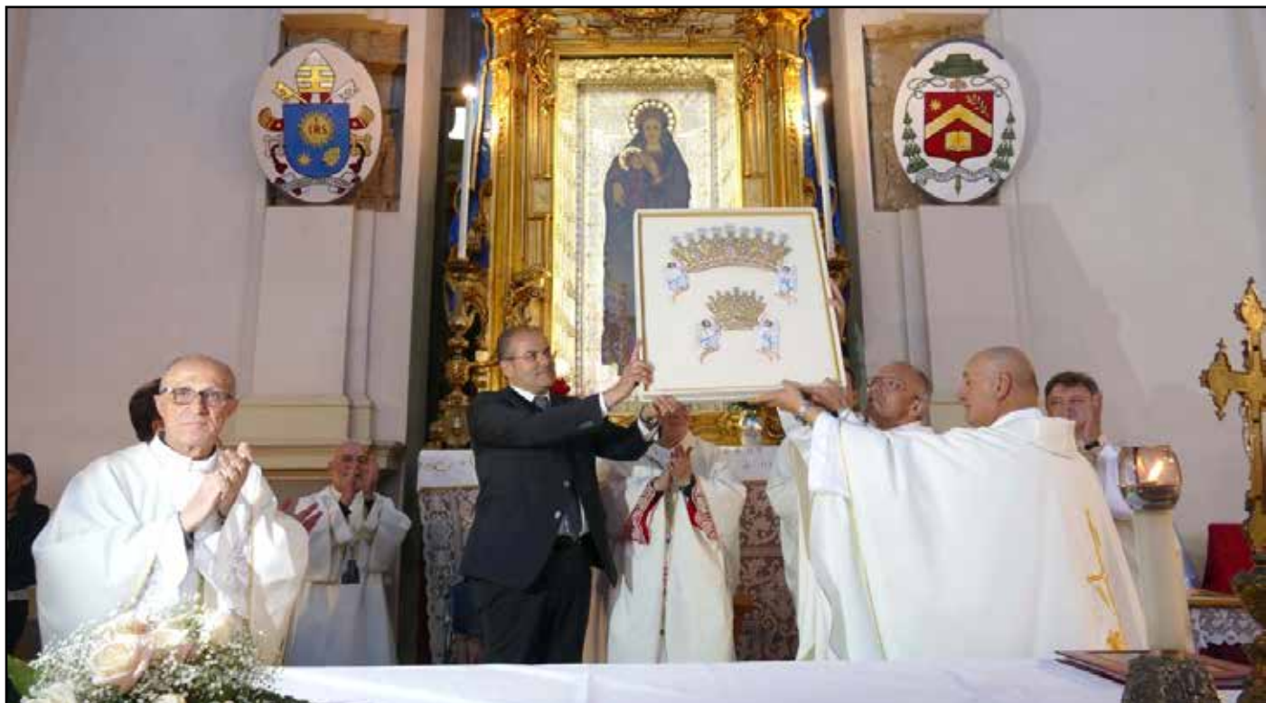
Prezentacja koron na obraz Matki Bożej Częstochowskiej przed obliczem Madonny z Capocolonna.