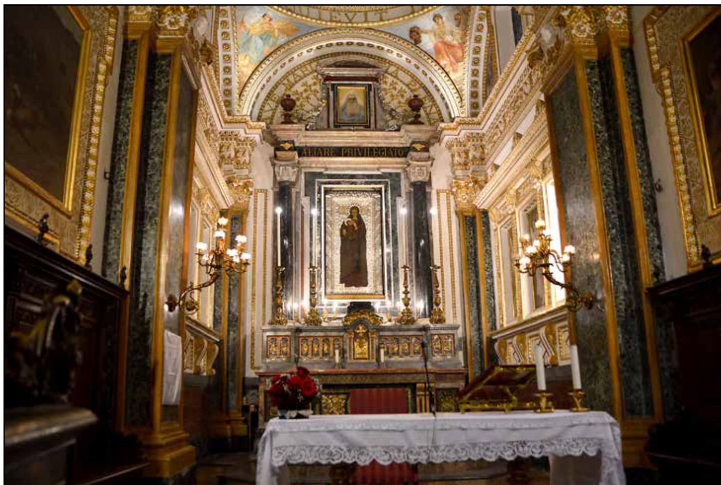
Sanktuarium Matki Bożej w Capocolonna w archidiecezji Crotone - Santa Severina