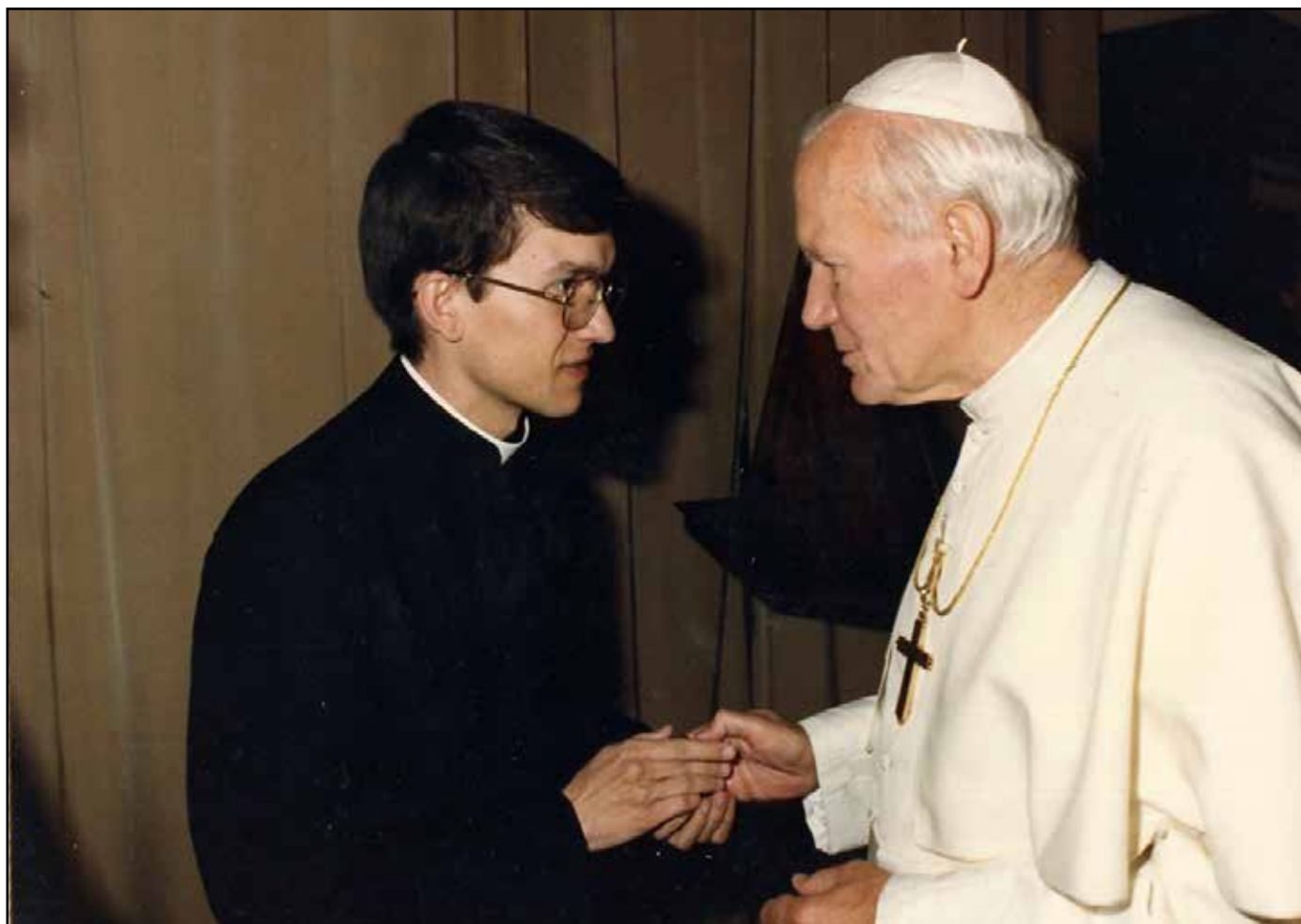
Watykan, 9 czerwca 1990 roku. Spotkanie ks. Andrzeja Sowińskiego z Ojcem Świętym Janem Pawłem II.