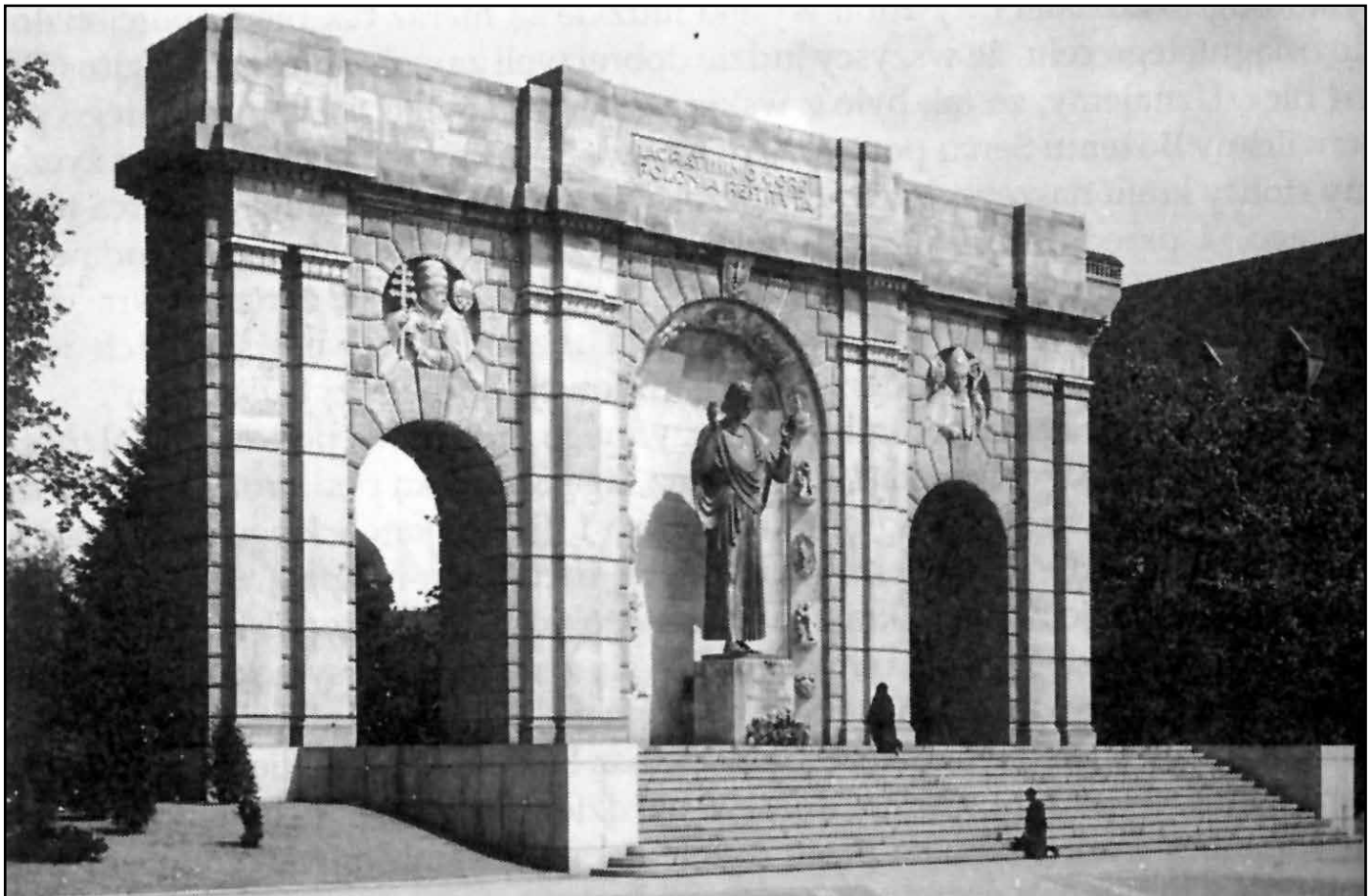
Pomnik Najświętszego Serca Pana Jezusa (Pomnik Wdzięczności) w Poznaniu. Został uroczystie odsłonięty 30 października 1932 roku. Zburzony przez Niemców w październiku 1939 roku. Czeka na rekonstrukcję od wielu lat...