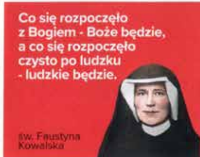
św. Faustyna Kowalska

Dwie Mamy rozmawiają z zaproszonymi gośćmi o różnych aspektach życia rodzinnego: O ojcostwie i roli ojca, o pielgrzymowaniu, o wprowadzaniu dzieci w atmosferę Wielkiego Postu i Adwentu oraz wielu innych tematach ważnych dla umacniania wiary w rodzinie.