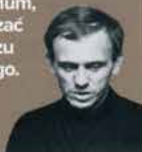
Bł. ksiądz Jerzy Popiełuszko

Pozostać sobą - żyć w Prawdzie - to jest minimum, aby nie zamazać w sobie obrazu dziecka Bożego.